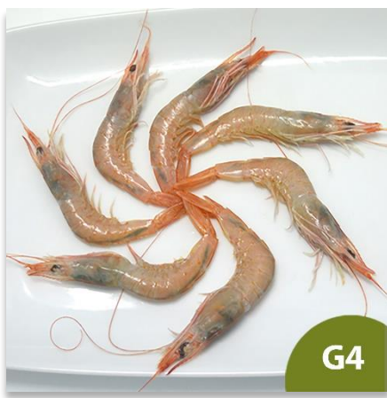
Gamba Blanca de Huelva Mediana G4 (80 a 100 pzas en kilo)