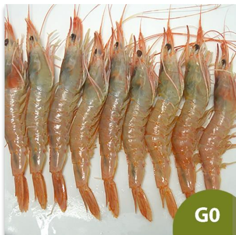
Gamba Blanca de Huelva Especial G0 (40 a 50 piezas en kilo)