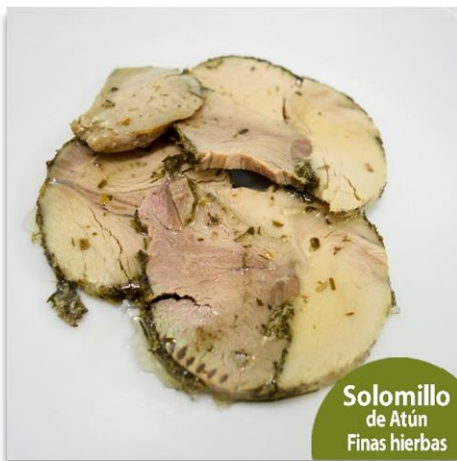
Solomillo de Atún Finas hierbas