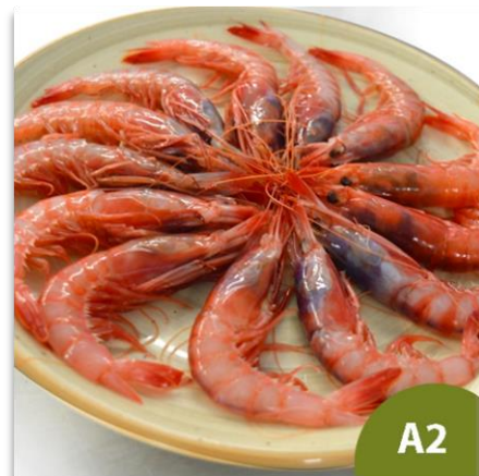
Alistado Extra A2 (35 a 45 piezas en kilo)