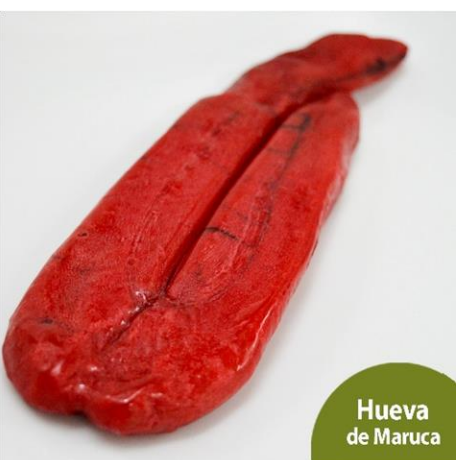
Hueva de maruca