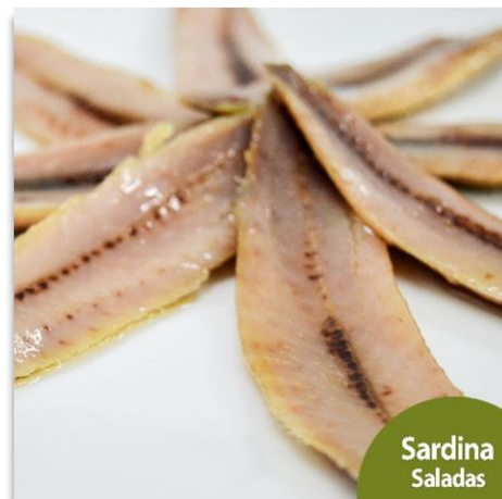
Filetes de sardinas saladas