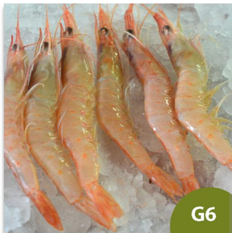
Gamba Blanca de Huelva Arrocerca G6 (de 120 a 140 piezas en kilo)