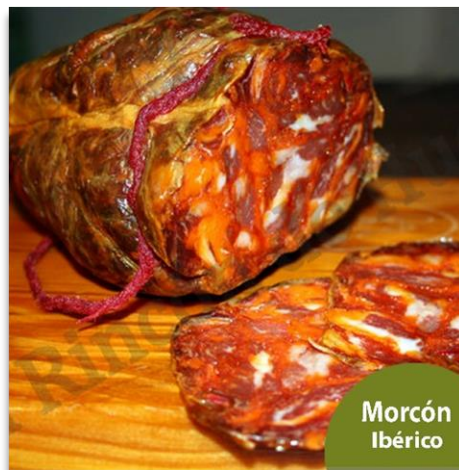
Morcón Ibérico de Bellota