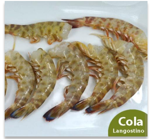
Cola de Langostino de Sanlúcar