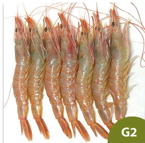
Gamba blanca de Huelva Extra G2 (60 a 70 Piezas en kilo)