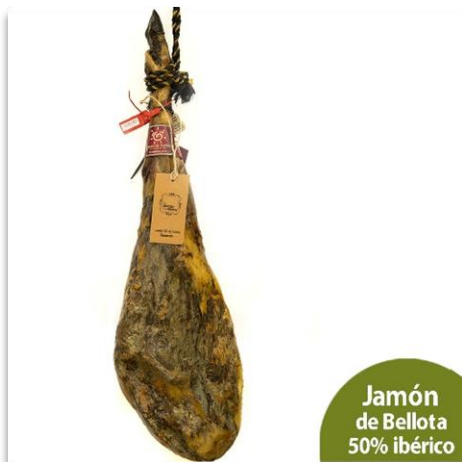
Jamón de Bellota 50% ibérico

Jamón de bellota 100% ibérico D.O.P. Jabugo, loncheado