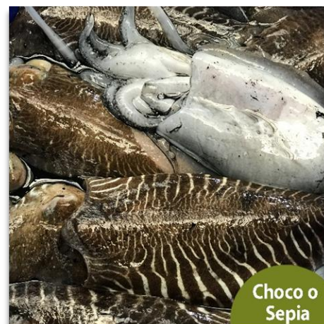
Choco o Sepia