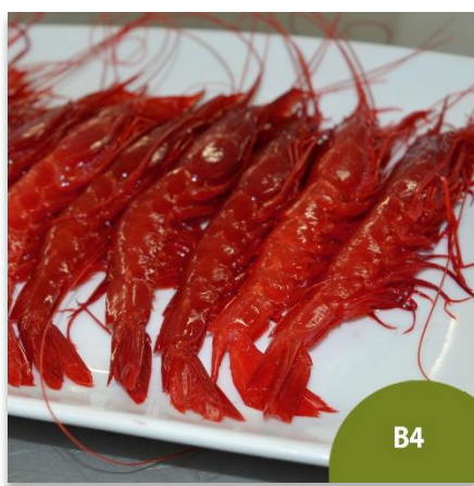
Carabinero o Brillante Mediano - B4 (23 a 35 piezas en kilo)