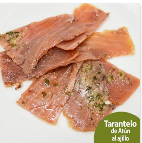
Tarantelo de Atún al ajillo