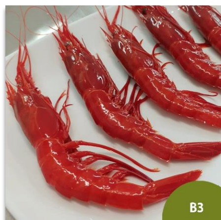
Carabinero o Brillante Gordo B3 (17 a 22 piezas en kilo)