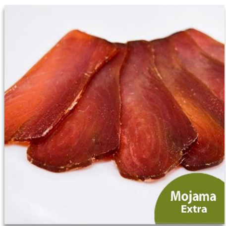
Mojama de Atún - Calidad Extra