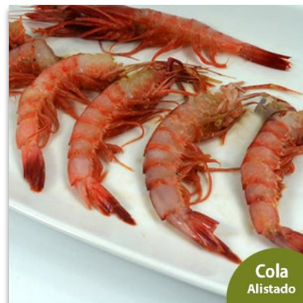
Cola de Alistado