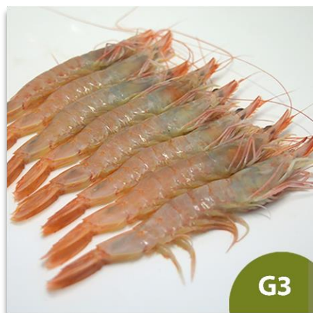
Gamba Blanca de Huelva Gorda G3 (70 a 80 piezas en kilo)