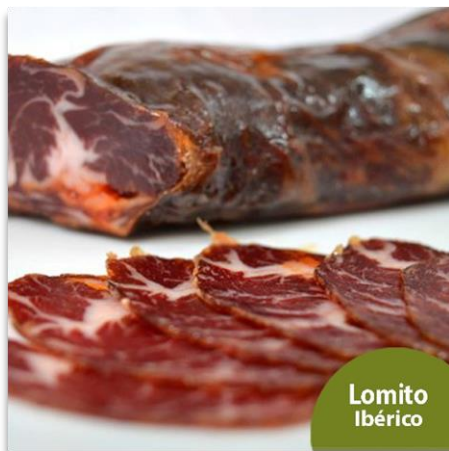
Lomito Ibérico de Bellota de Presa