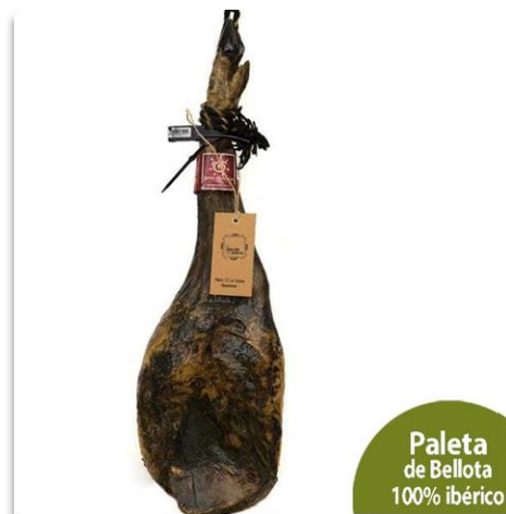
Paleta de Bellota 100% ibérico

Jamón de Cebo 50% Ibérico, brida blanca. 7,5-8.5 kg.