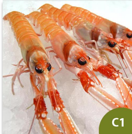
Cigalas de Huelva Tronco C1 (6 a 8 piezas en kilo)