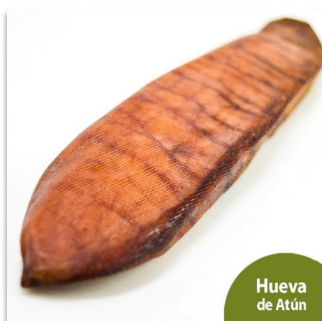
Hueva de atún