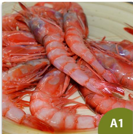
Alistado Tronco A1 (25 a 35 piezas en kilo)