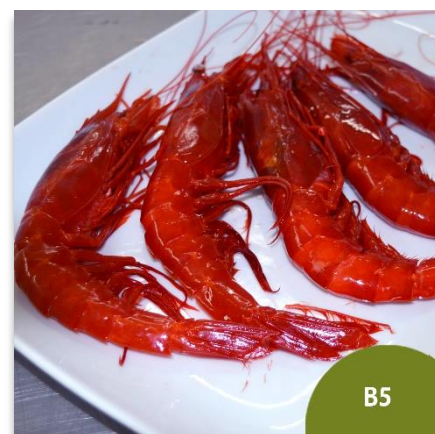
Carabinero o Brillante Pequeño - B5 (35 a 50 piezas en kilo)