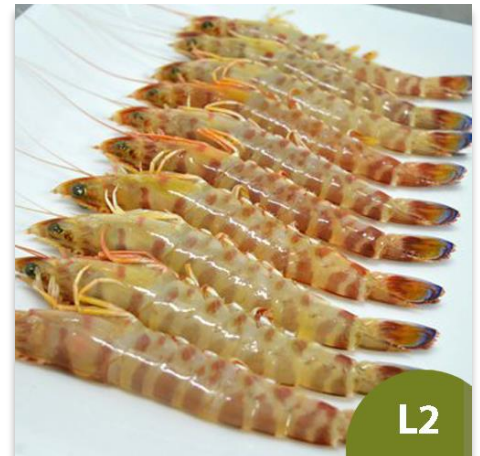
Langostino de Sanlúcar Especial L0 (15 a 20 piezas en kilo)