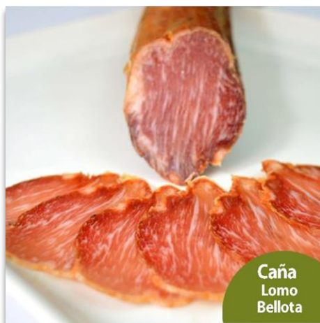
Caña de lomo de bellota, 100% Ibérico, Clásica