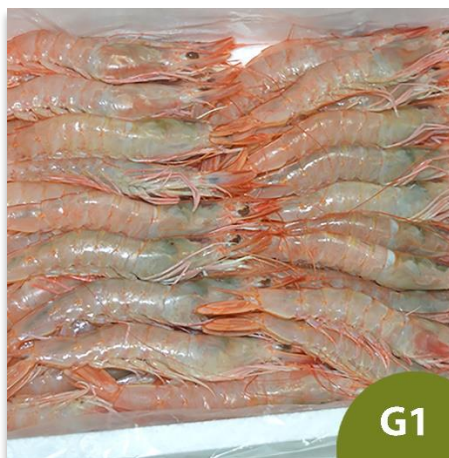
Gamba Blanca de Huelva Tronco G1 (50 a 60 piezas en kilo)