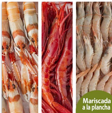
Mariscada a la plancha