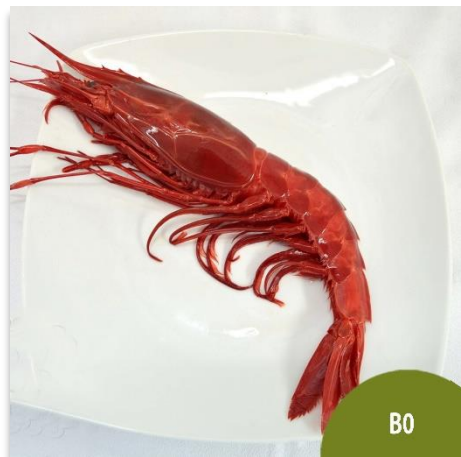
Carabinero o Brillante Especial B0 (6 a 8 piezas en kilo)