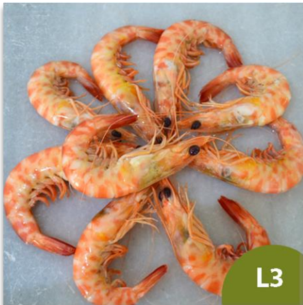
Langostino de Sanlúcar Gordo L3 (40 a 60 piezas en kilo)