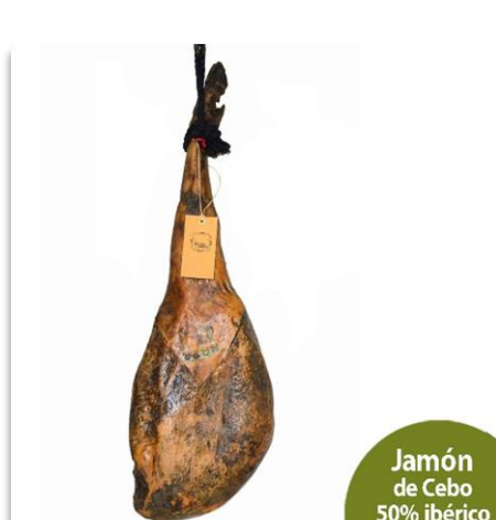
Jamón de Cebo 50% ibérico

Paleta de Bellota 100% Ibérico, brida negra. DOP Jabugo. 4,5 a 5,5 kg