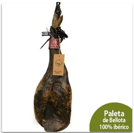
Paleta de Bellota 100% Ibérico

Paleta Cebo de Campo 50% Ibérico, brida verde. 5-5.5 kg.