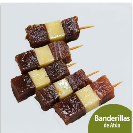
Banderillas de Atún