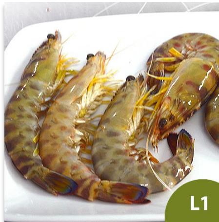
Langostino de Sanlúcar Tronco L1 (20 a 30 piezas en kilo)