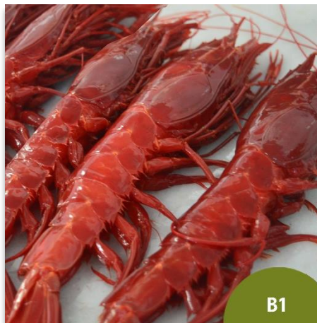
Carabinero o Brillante Tronco B1 (9 a 11 piezas en kilo)