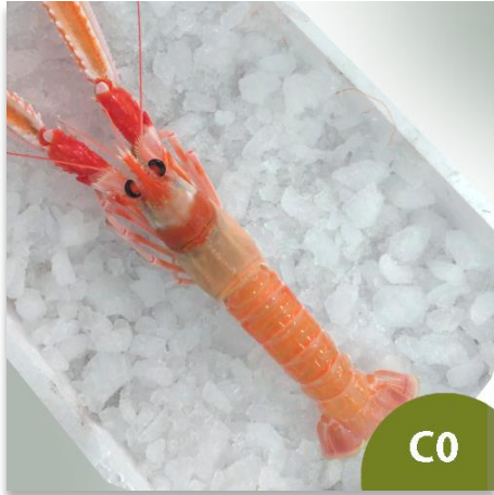
Cigalas de Huelva Especial C0 (3 a 5 piezas en Kilo)