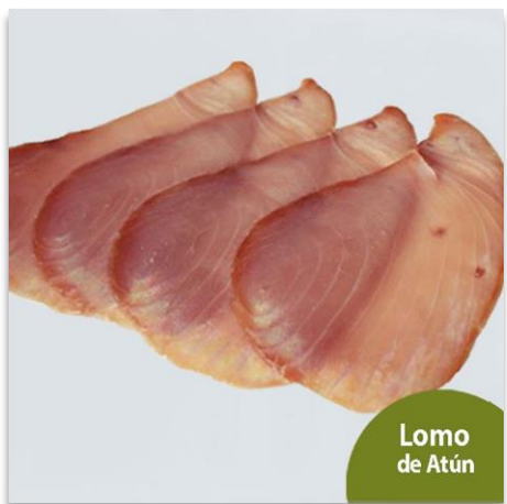
Lomo de Atún