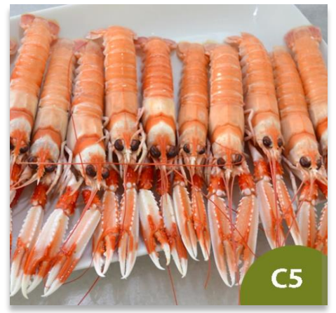
Cigala de Huelva Pequeña C5 (26 a 40 piezas en kilo)