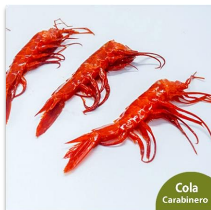
Cola de Carabinero