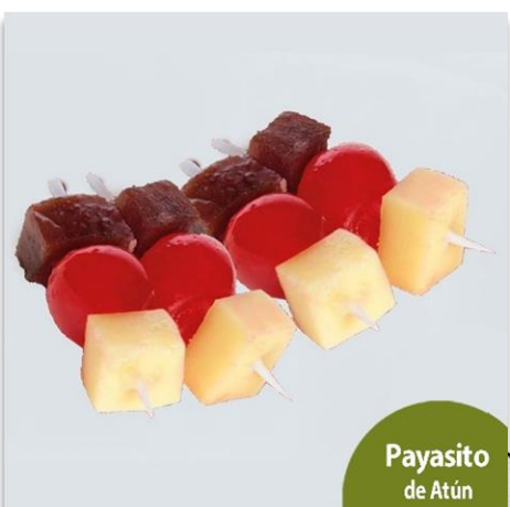
Payasitos de atún, queso y cereza