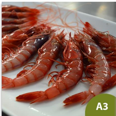
Alistado Gordo A3 (45 a 60 piezas en kilo)