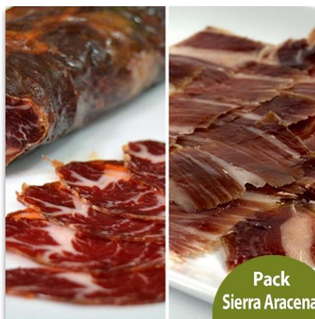
Pack Sierra Aracena