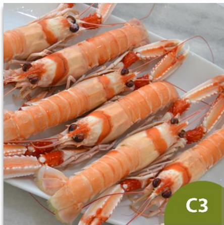
Cigala de Huelva Gorda C3 (12 a 17 piezas en kilo)