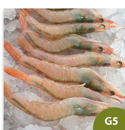
Gamba Blanca de Huelva Pequeña G5 (100 a 120 piezas en kilo)