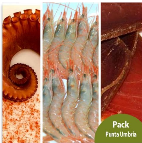
Pack Punta Umbría