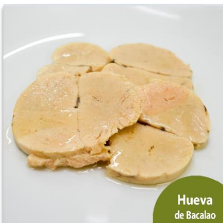
Hueva de Bacalao