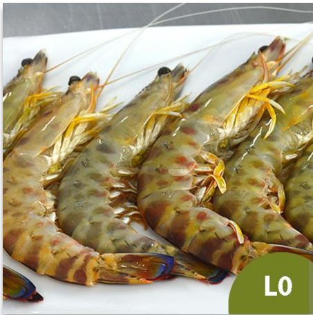
Langostino de Sanlúcar Especial L0 (15 a 20 piezas en kilo)