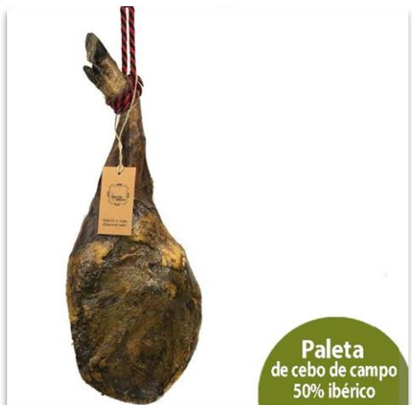
Paleta de Cebo de Campo 50% ibérico

Paleta Cebo de Campo 50% Ibérico, brida verde. 5-5.5 kg.