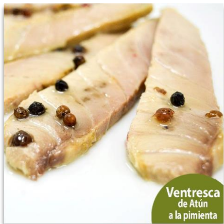
Ventresca de Atún a la pimienta