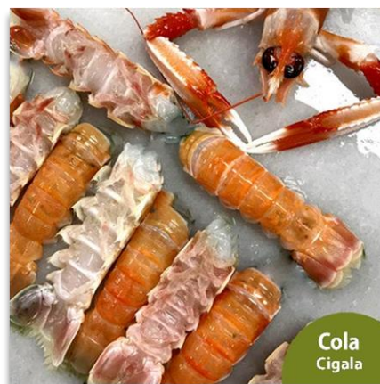
Cola de Cigala