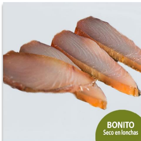
Bonito seco en lonchas