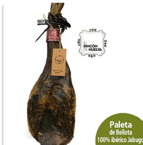
Paleta de Bellota 100% ibérico Jabugo

Paleta de Bellota 100% Ibérico, brida negra. DOP Jabugo. 4,5 a 5,5 kg