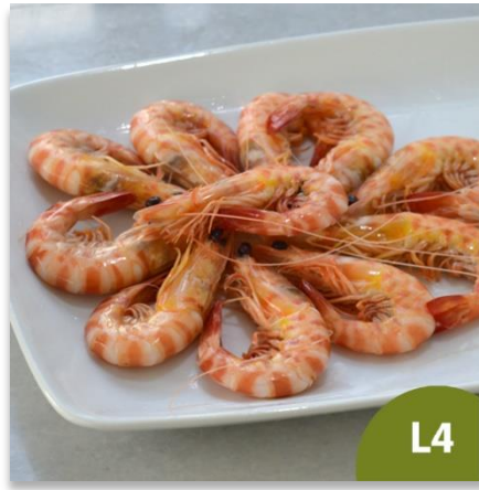
Langostino de Sanlúcar mediano L4 (de 60 a 70 piezas aproximadamente)