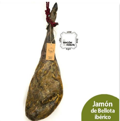
Jamón de Bellota 100% ibérico

Jamón de Bellota 50% Ibérico, brida roja, 7-9 kg