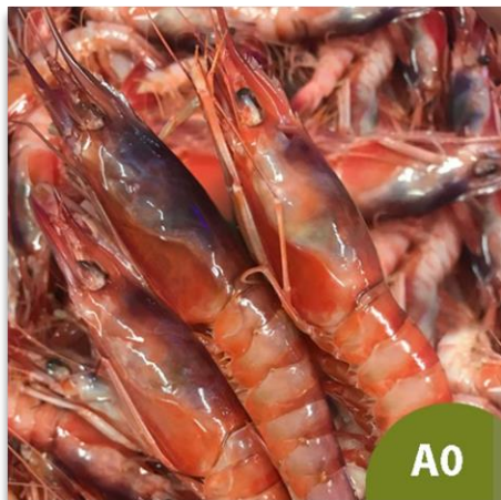
Alistado Especial A0 (15 a 25 piezas en kilo)