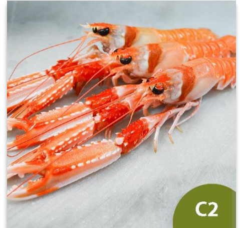
Cigala de Huelva Gorda C3 (12 a 17 piezas en kilo)