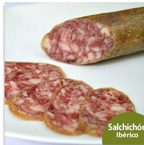
Salchichón Cular Ibérico de Bellota