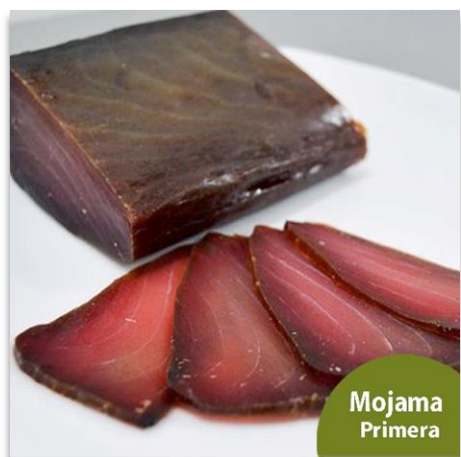
Mojama de Atún - Calidad de Primera