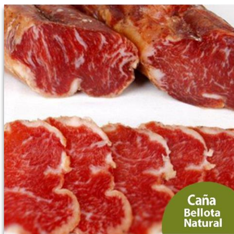
Caña de lomo de bellota, Natural Sin Pimentón