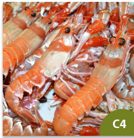
Cigala de Huelva Mediana C4 (18 a 25 piezas en kilo)