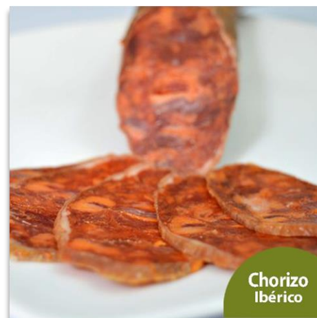
Chorizo Cular Ibérico de Bellota