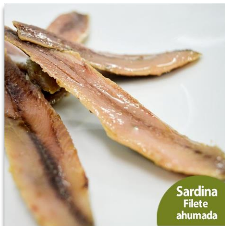
Filetes de sardinas ahumadas