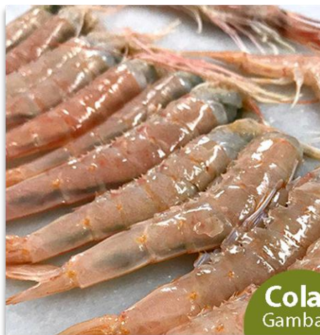
Cola de Gamba Blanca de Huelva