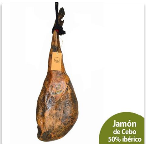
Jamón de Cebo 50% ibérico

Jamón de Bellota 100% Ibérico, brida negra. 7 a 8 kg. Añada 2017. El