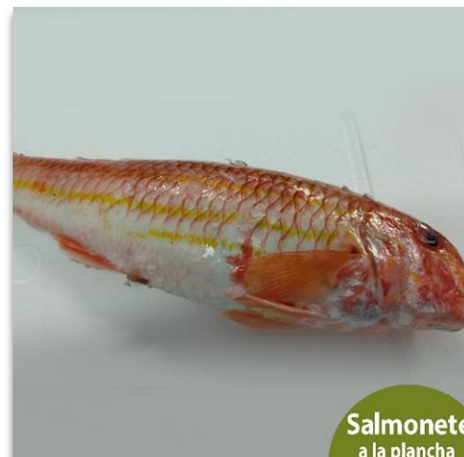
Salmonete a la plancha