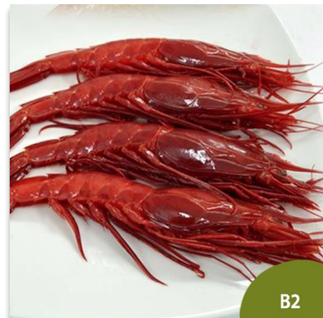
Carabinero o Brillante Extra B2 (12 a 16 piezas en kilo)