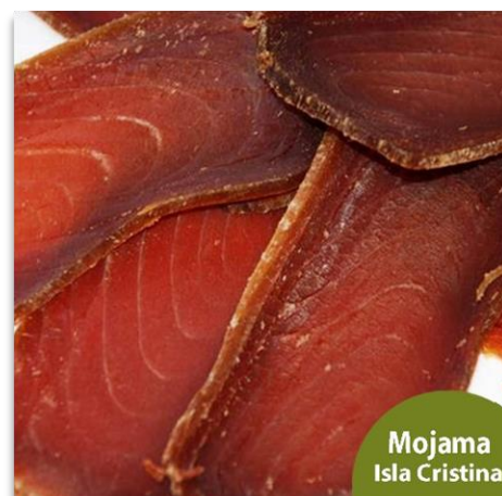
Mojama de Isla Cristina loncheada