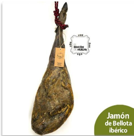
Jamón de Bellota 100% ibérico

Jamón de bellota 100% ibérico D.O.P. Jabugo, loncheado