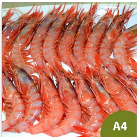
Alistado Mediano A4 (60 a 80 piezas en kilo)